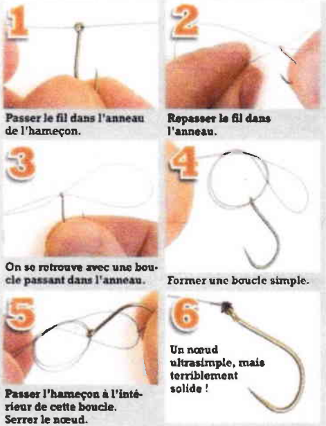
1 Passer le fil dans l'anneau de l'hameçon.