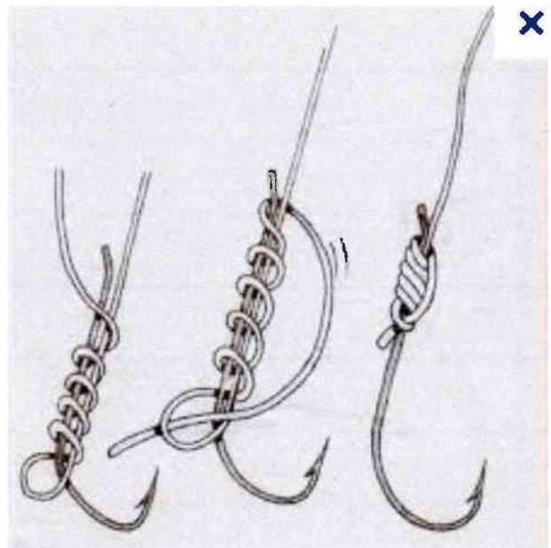
6 Un nœud ultrasimple, mais terriblement solide !